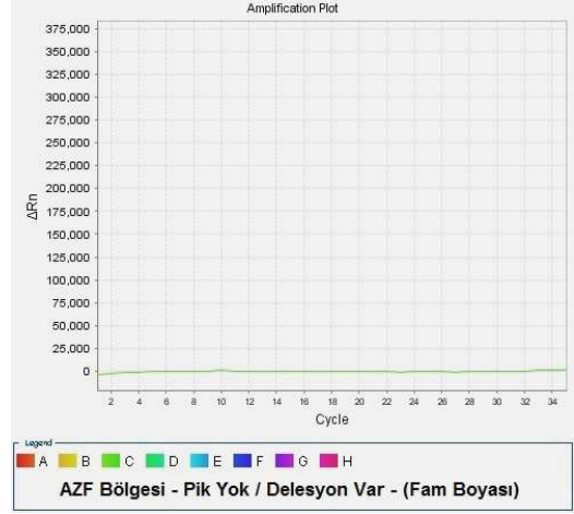
Şekil 3 : Miks 3, HEX/JOE Boyası – SY134 Delesyon Pozitif