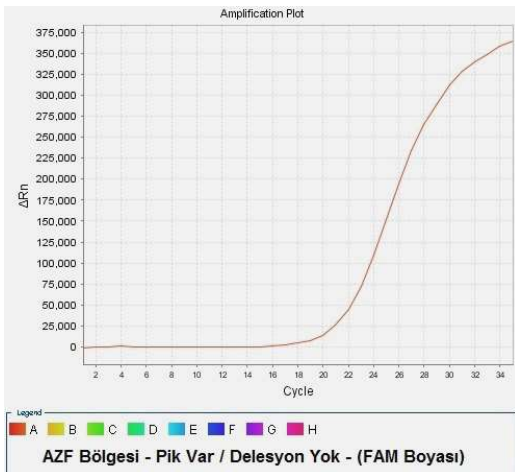
Şekil 2 : Miks 2, FAM Boyası – SY127 Delesyon negatif

İnternal kontrol DNA eklediğiniz tüm kuyularda CY5 boyasında pik vermeli ve CT değeri 18 \leq X \leq 25 aralığında olmalıdır (Şekil: 1). Pik alamadığınız durumlar için "olası problemler" bölümüne bakabilirsiniz.