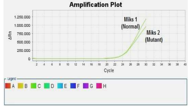
Şekil 3: FII Heterozigot (Miks 1 – Miks 2, FAM)